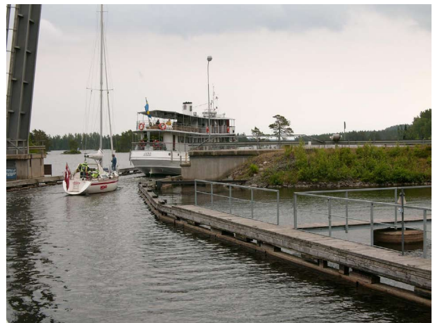
Schmale Durchfahrt im Schärengewässer

V or Rügen winkte uns der Skipper eines Katamarans zu sich. Es stellte sich heraus, dass seine Begleiterin dringend ärztlicher Hilfe bedurfte. Funk hatte er nicht an Bord und das Handy war leer. So alarmierten wir die Küstenwache und wickelten den Funkverkehr ab. Bis zum Eintreffen des Rettungsschiffes blieben wir in seiner Nähe. Es war für uns eine wertvolle Erfahrung, einmal ohne eigene Not zu erleben, wie das was man oft im Kopf durchgespielt und fürs Funksprechzeugnis gelernt hat, in der Realität abläuft.