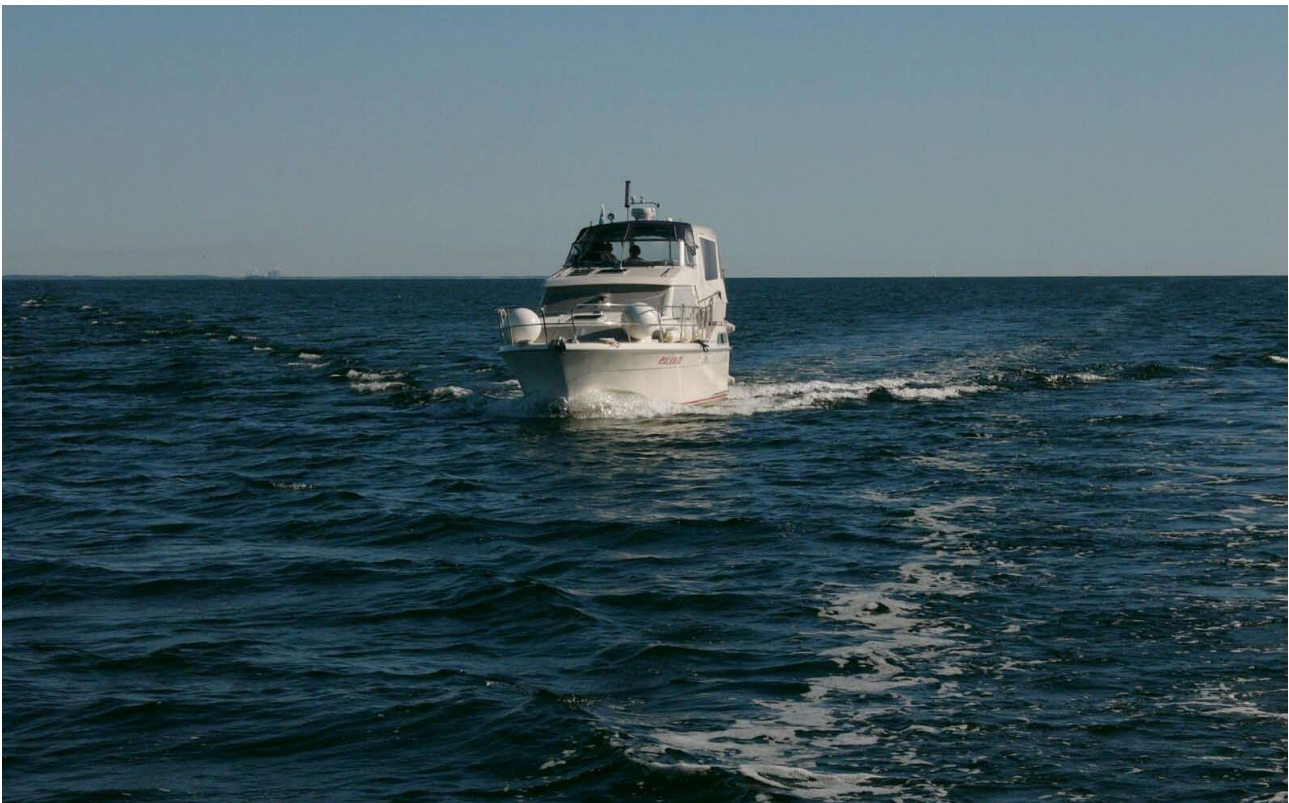
Auf der Ostsee