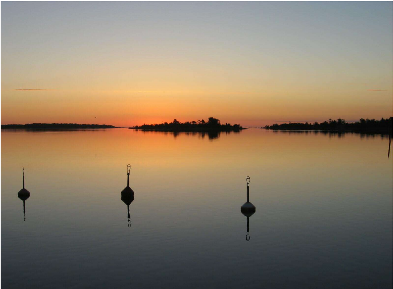
Sonnenaufgangsstimmung in den Schären