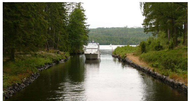
Auf dem Götakanal

Schwedisch Vorpommern auf Rügen geboren, gelang es Anfang des 19. Jahrhunderts, den Reichstag und den König von Schweden für das Projekt und damit für die Finanzierung zu gewinnen. In den Kanalbau floss auch Ingenieurskunst aus Frankreich und insbesondere aus Schottland ein. Der Kanal klettert bis auf 92 m Meereshöhe und erlaubt selbst Segelbooten mit einer Masthöhe bis 22 m die Durchfahrt, Dreh- und Klappbrücken machen es möglich.