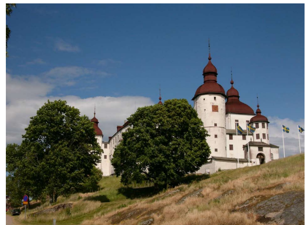
Schloss Läckö im Vänern See

Die Schweden sind Sonnenanbeter. Sie kleiden sich gern nach dem Modell einer Zwiebelschale. Sobald die Sonne hervorkommt, legen sie die oberen Schalen ab, um ihre Haut schonungslos der Sonne auszusetzen. Auch scheinen sie die Weltmeister im Eis schlecken zu sein: morgens, mittags, abends, egal wie kühl oder warm es gerade ist und welche Tätigkeit man gerade verrichtet – so lange nur eine Hand fürs Eis frei ist. In Söderköping gibt es sogar ein weithin bekanntes richtiges Eisrestaurant – kein Eiscafé! – in dem Eisportionen im Umfang ganzer Mahlzeiten aufgetischt werden. Und das Eis ist wirklich überall ausgezeichnet. Wir haben es ausgiebig getestet.