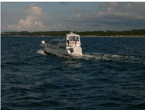
Entlang der schwedischen Ostküste

So starteten wir Anfang Mai bei strahlendem Sonnenschein in Traben-Trarbach. Schon nach drei Tagen machten wir im Duisburger Innenhafen fest, der über eine empfehlenswerte Marina nahe zur Innenstadt verfügt. Von hier aus ging es weiter über den Rhein-Herne- und Dortmund-Ems-Kanal. Es war ein Wochenende und so bevölkerten viele Sonnenanbeter und Wassersportler die Ufer- und Wasserflächen. Vorsichtiges Fahren war angesagt. Über Mittelland- und Elbe-Seitenkanal erreichten wir am 14. Tag Hamburg und nach drei weiteren Tagen Kiel. Weiter ging es über Maasholm in der Schleimündung, den Kleinen Belt, Samsö, und das Kattegatt. Wetter bedingt mussten wir mehrmals einige Tage Pause einlegen. In Göteborg kamen wir genau einen Monat nach unserem Fahrtbeginn an. Wegen eines angekündigten Wetterumschwungs hatten wir