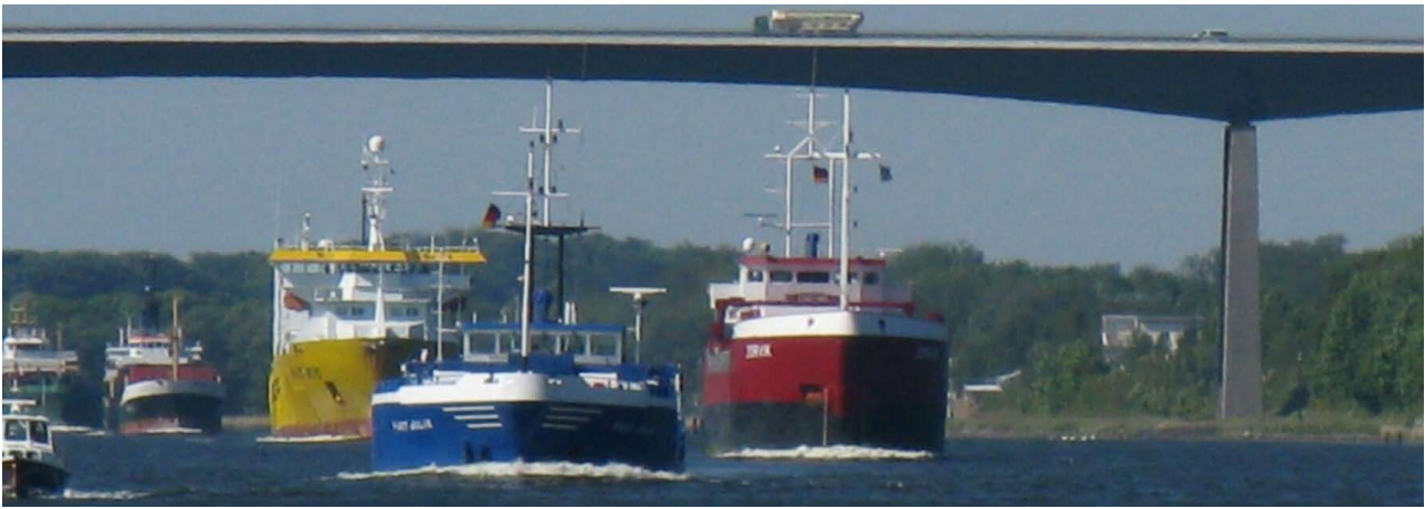
Gedränge im Nordostseekanal

Schleusvorgang eingewiesen. Alle Schleusen des Kanals waren identisch. Und wenn die Crews sich vorher gut abgesprochen, den Vorgang einige Male geübt hatten und stets die Ruhe bewahrten, war die Schleusung völlig unproblematisch, zumal das Schleusenpersonal z.B. an den etwas anspruchsvolleren Schleusentrepfen sehr hilfsbereit war.